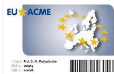
The new EU-ACME membership card

It is possible that you still have an old EU-ACME membership card. In 2009 a new personal EU-ACME membership card was developed which meets the requirements of the new portable scanners. If you still did not receive the new card or you have issues with the new cards please contact the EU-ACME office .